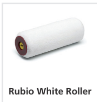
Rubio White Roller